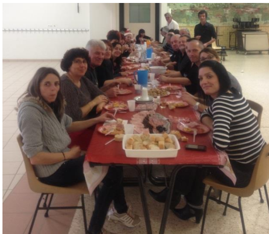
Repas avec les bénévoles et les maires

Etant donné le nombre important d'enfants regroupés sur un même site, nous avons sollicité des parents bénévoles pour aider au service du repas.